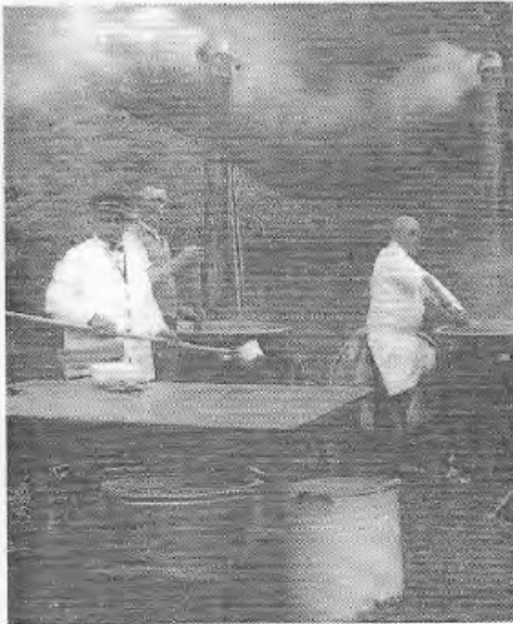
Beim Sportfest wurde in der Gulaschkanone Bohnensuppe für 600 jüdische Sportler gekocht, die sich im „Haus Berta“ trafen.